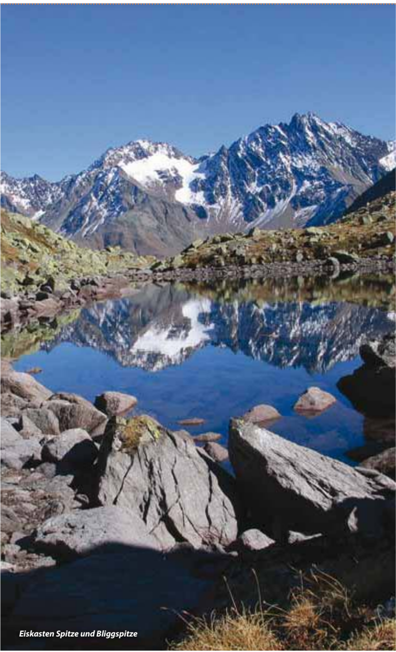
Eiskasten Spitze und Bliggspitze