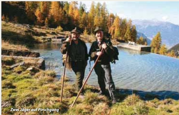
Zwei Jäger auf Pirschgang

Sonstiges: Wanderschuhe, Anmeldung erforderlich.