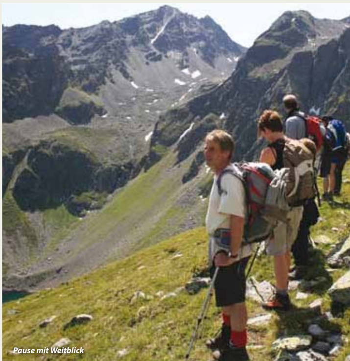
Pause mit Weitblick

Informationen zu Abfahrtszeiten Naturparkbus unter www.kaunergrat.at