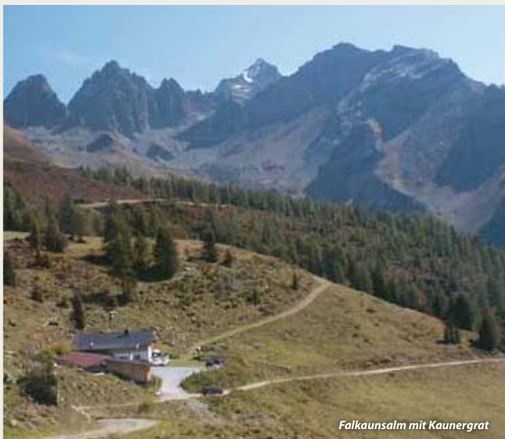
Falkaunsalm mit Kaunergrat