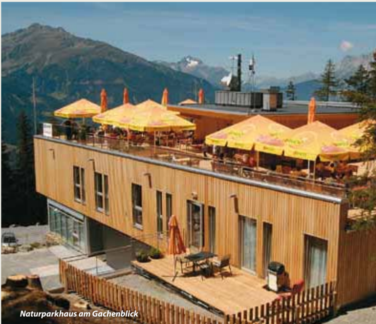
Naturparkhaus am Gachenblick

Unser Cafe-Restaurant Gachenblick empfiehlt sich auch ganz besonders für verschiedenste Feierlichkeiten: Hochzeiten, Taufen, Firmungen, Geburtstage, Familienfeste und Jubiläen. Wir freuen uns auf Ihren Anruf und unterstützen Sie gerne bei der Ausrichtung Ihrer Feier!