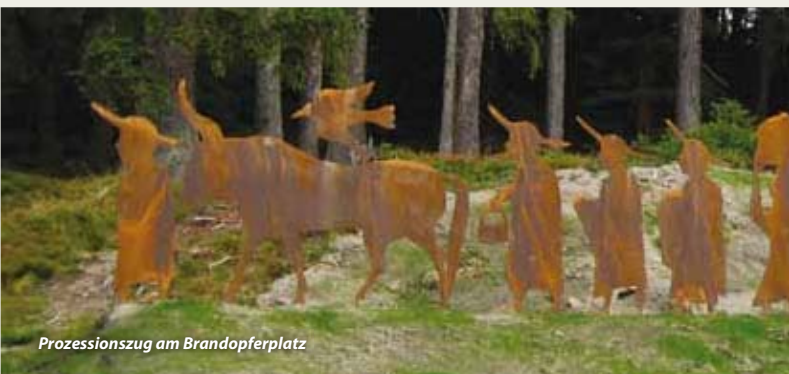
Prozessionszug am Brandopferplatz

Unser TIPP: Nutzen Sie den Naturpark Wanderbus für ausgedehnte Wanderungen am Venet!