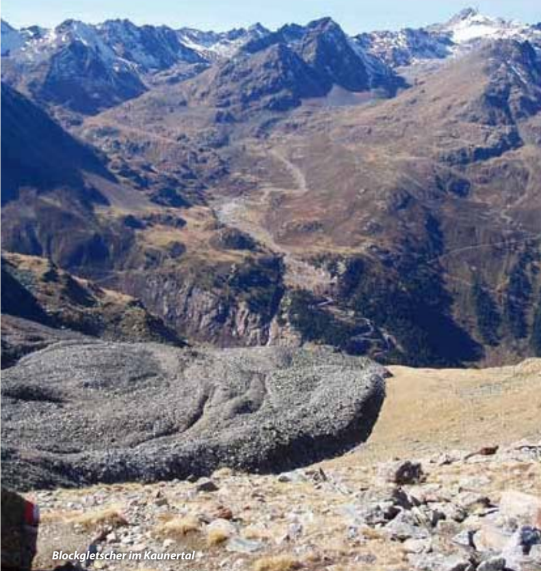
Blockgletscher im Kaunertal