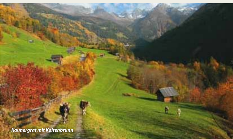
Kaunergrat mit Kaltenbrunn

Und fürwahr die Leistungen am Kaunergrat können sich sehen lassen: Bau des 1. Naturparkhauses in Tirol und die erfolgreiche Integration in das Tourismus- und Freizeitangebot der Region (über 150.000 Besucher jedes Jahr!), über 1000 betreute Kinder jedes Schuljahr, 120 Veranstaltungen im Sommer- und Winterprogramm, ein konsequenter Aufbau der Direktvermarktung von Anbeginn an und eine interdisziplinäre Forschungsarbeit sind Ausdruck einer kontinuierlichen und erfolgreichen Arbeit.